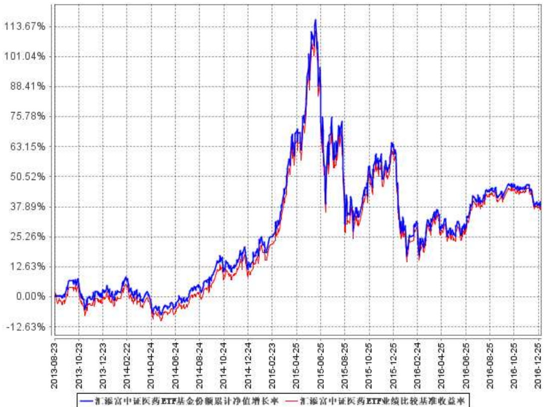
汇添富中证医药ETF基金份额累计净值增长率与同期业绩比较基准收益率的历史走势对比图

注：本基金建仓期为自《基金合同》生效之日（2013 年 8 月 23 日）起 3 个月，建仓期结束时各项资产配置比例符合合同约定。