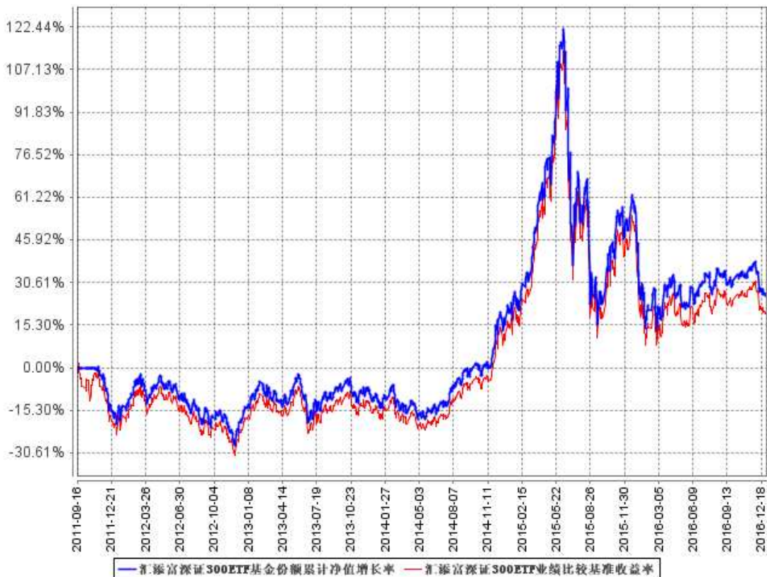
汇添富深证300ETF基金份额累计净值增长率与同期业绩比较基准收益率的历史走势对比图

注：本基金建仓期为本《基金合同》生效之日（2011年9月16日）起3个月，建仓期结束时各项资产配置比例符合合同约定。