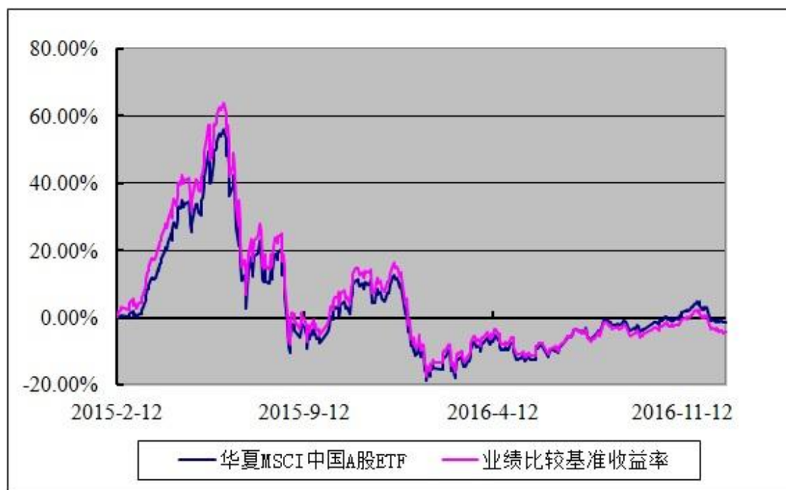
MSCI 中国 A 股交易型开放式指数证券投资基金 份额累计净值增长率与业绩比较基准收益率历史走势对比图 (2015 年 2 月 12 日至 2016 年 12 月 31 日)