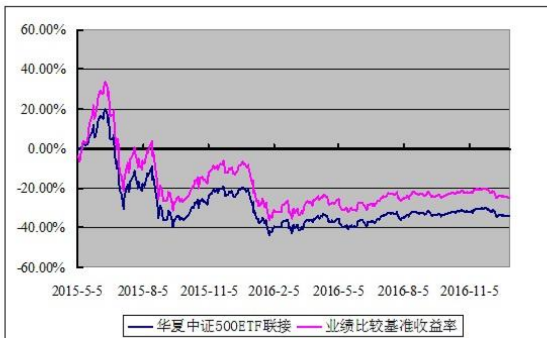
华夏中证 500 交易型开放式指数证券投资基金联接基金 份额累计净值增长率与业绩比较基准收益率历史走势对比图 (2015 年 5 月 5 日至 2016 年 12 月 31 日)