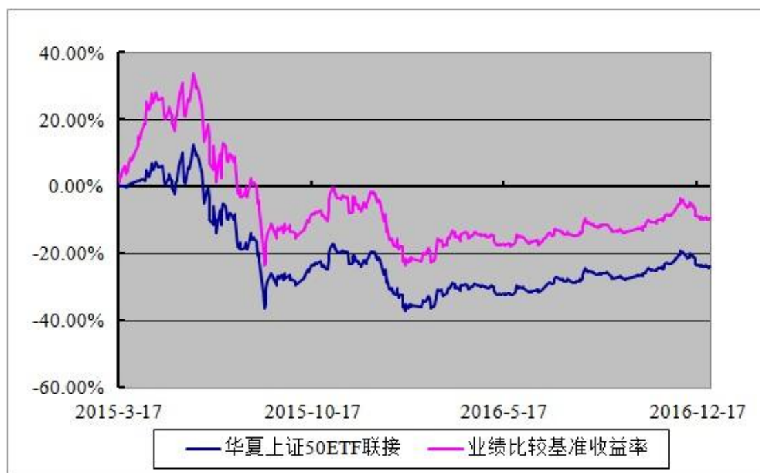
华夏上证 50 交易型开放式指数证券投资基金联接基金 份额累计净值增长率与业绩比较基准收益率历史走势对比图 (2015 年 3 月 17 日至 2016 年 12 月 31 日)