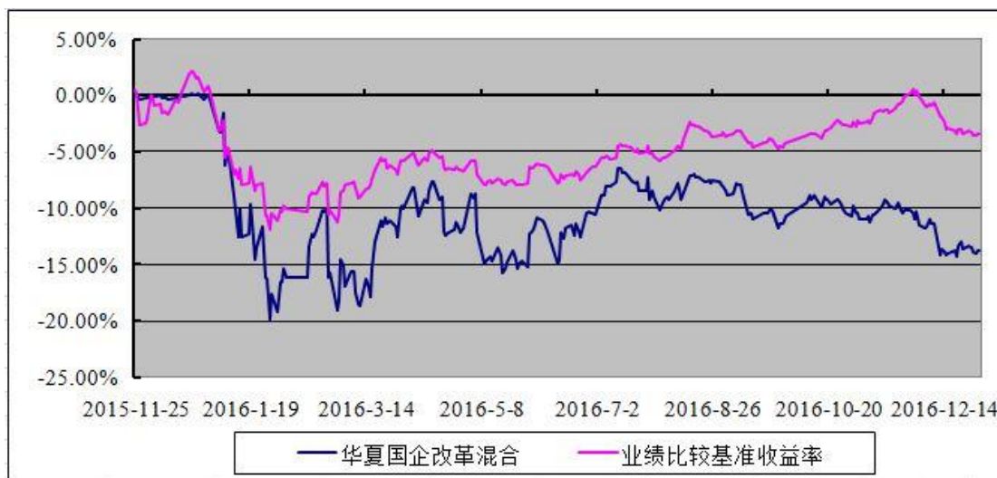
华夏国企改革灵活配置混合型证券投资基金 份额累计净值增长率与业绩比较基准收益率历史走势对比图 (2015 年 11 月 25 日至 2016 年 12 月 31 日)

注：根据华夏国企改革灵活配置混合型证券投资基金的基金合同规定，本基金自基金合同生效之日起 6 个月内使基金的投资组合比例符合本基金合同第十二部分“二、投资范围”、“四、投资限制”的有关约定。