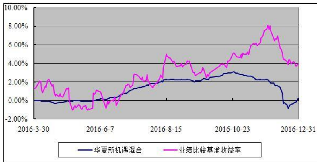
华夏新机遇灵活配置混合型证券投资基金 份额累计净值增长率与业绩比较基准收益率历史走势对比图 (2016 年 3 月 30 日至 2016 年 12 月 31 日)