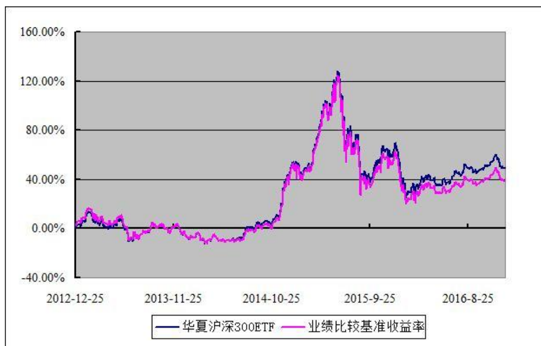
华夏沪深 300 交易型开放式指数证券投资基金 份额累计净值增长率与业绩比较基准收益率历史走势对比图 (2012 年 12 月 25 日至 2016 年 12 月 31 日)