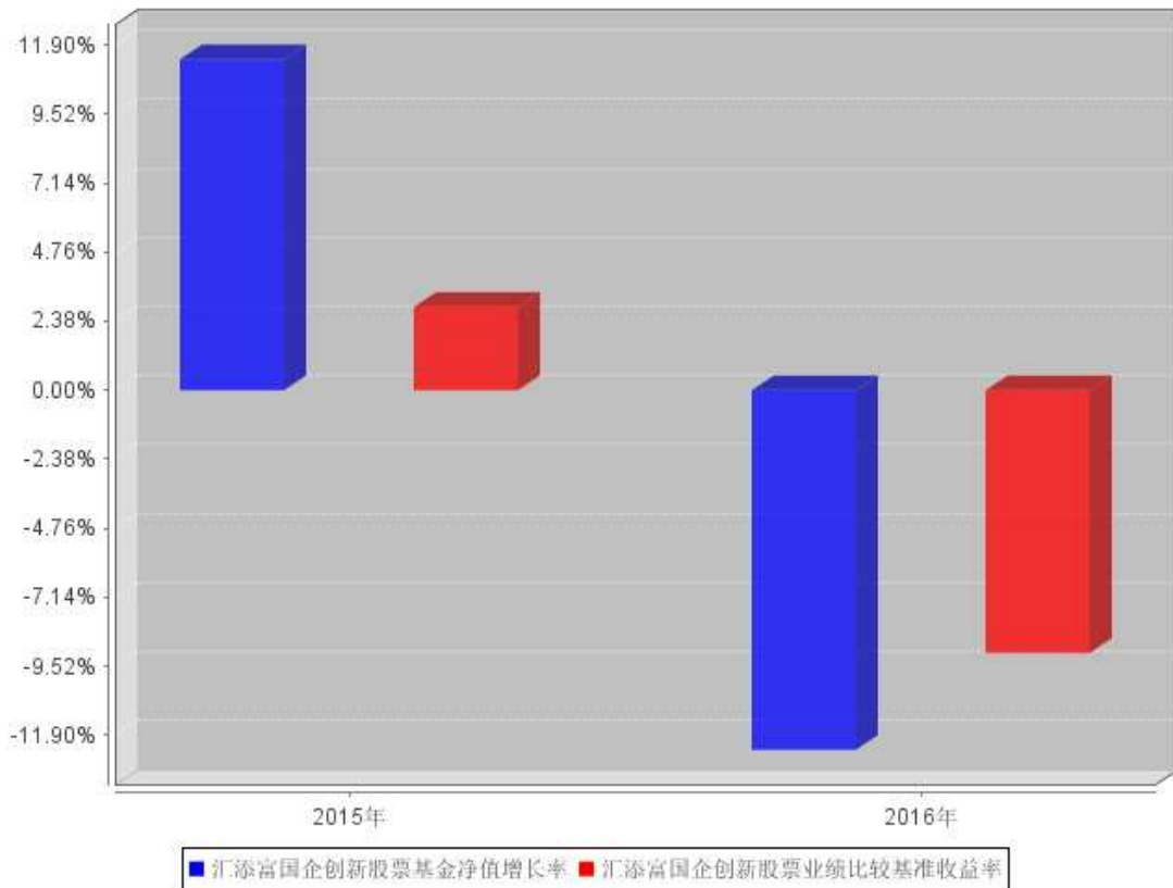
汇添富国企创新股票自基金合同生效以来基金每年净值增长率及其与同期业绩比较基准收益率的对比图

注：1、本基金的《基金合同》生效日为 2015 年 7 月 10 日，至本报告期末未满三年。