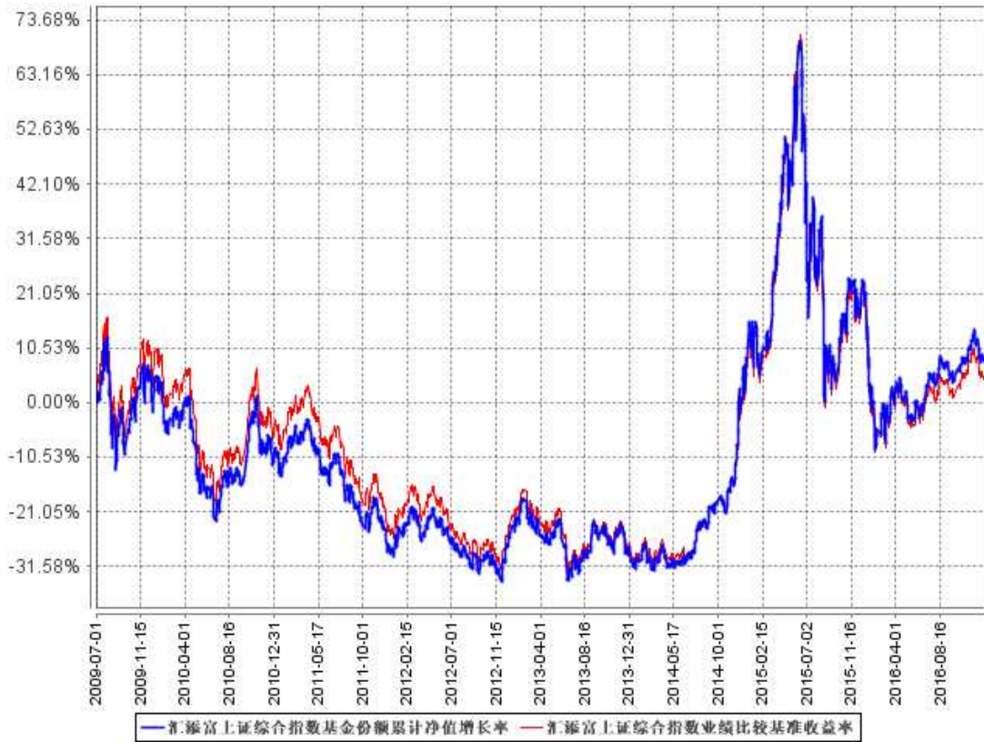
汇添富上证综合指数基金份额累计净值增长率与同期业绩比较基准收益率的历史走势对比图

注：本基金建仓期为本《基金合同》生效之日（2009年7月1日）起3个月，建仓期结束时各项资产配置比例符合合同规定。