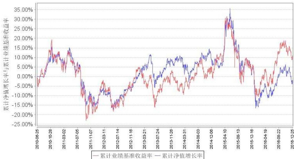
累计净值增长率与同期业绩比较基准收益率的历史走势对比图

注：本基金建仓期为本《基金合同》生效之日（2010 年 6 月 25 日）起 6 个月，建仓结束时各项资产配置比例符合合同规定。