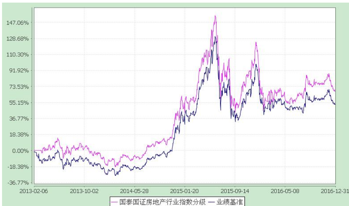
自基金合同生效以来份额累计净值增长率与业绩比较基准收益率的历史走势对比图 (2013 年 2 月 6 日至 2016 年 12 月 31 日)