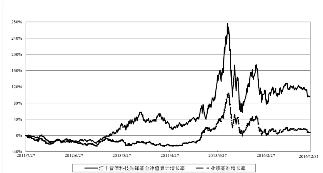
汇丰晋信科技先锋股票型证券投资基金 份额累计净值增长率与业绩比较基准收益率历史走势对比图 (2011 年 7 月 27 日至 2016 年 12 月 31 日)