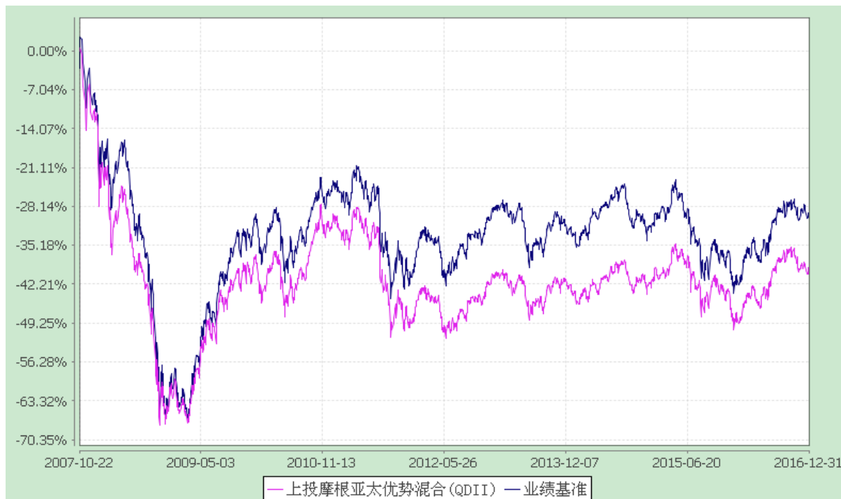
上投摩根亚太优势混合型证券投资基金 自基金合同生效以来份额累计净值增长率与业绩比较基准收益率历史走势对比图 (2007 年 10 月 22 日至 2016 年 12 月 31 日)

注：本基金合同生效日为 2007 年 10 月 22 日，图示时间段为 2007 年 10 月 22 日至 2016 年 12 月 31 日。