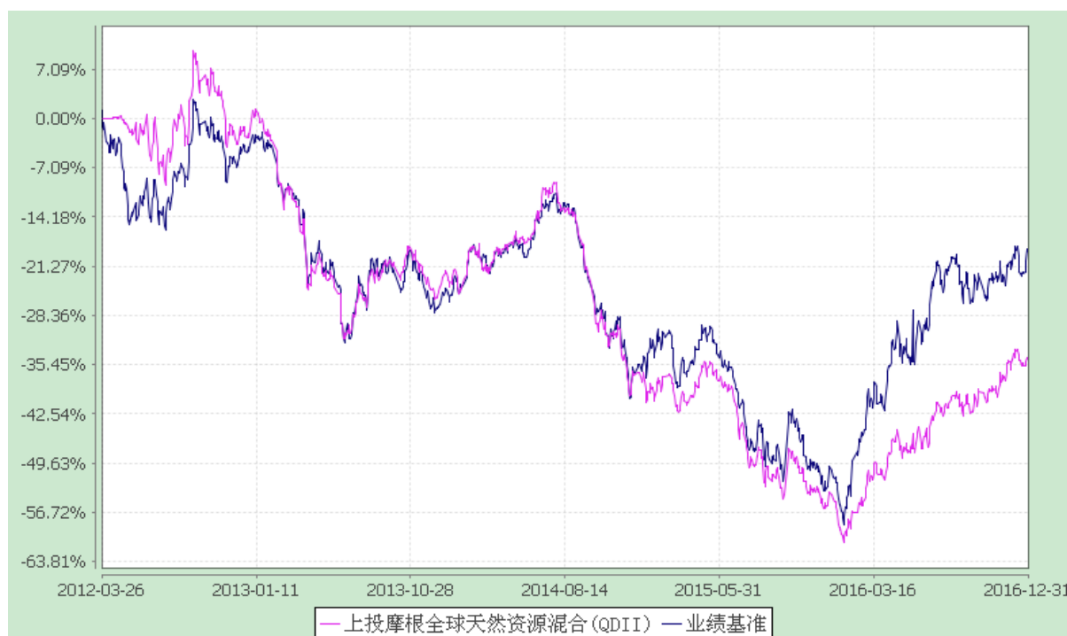
上投摩根全球天然资源混合型证券投资基金 自基金合同生效以来份额累计净值增长率与业绩比较基准收益率历史走势对比图 (2012 年 3 月 26 日至 2016 年 12 月 31 日)

注：本基金合同生效日为 2012 年 3 月 26 日，图示时间段为 2012 年 3 月 26 日至 2016 年 12 月 31 日。