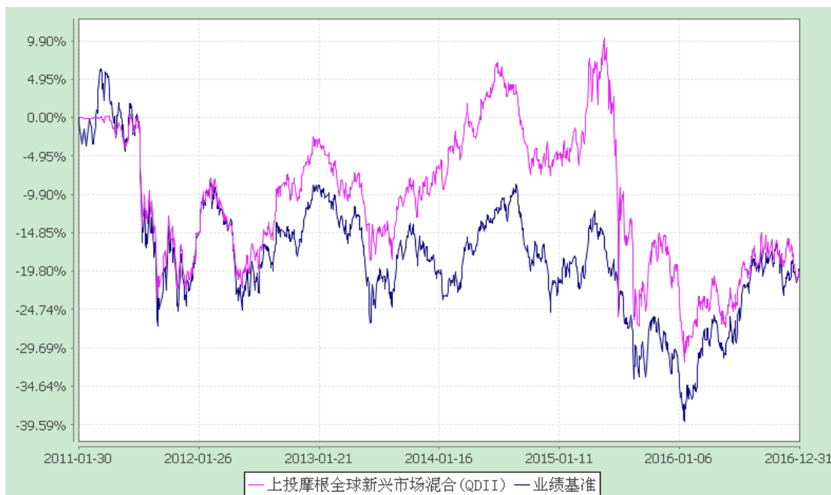
上投摩根全球新兴市场混合型证券投资基金 自基金合同生效以来份额累计净值增长率与业绩比较基准收益率历史走势对比图 (2011 年 1 月 30 日至 2016 年 12 月 31 日)

注：本基金合同生效日为 2011 年 1 月 30 日，图示时间段为 2011 年 1 月 30 日至 2016 年 12 月 31 日。