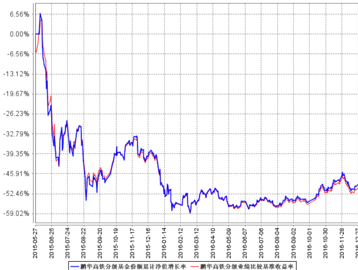
鹏华高铁分级基金份额累计净值增长率与同期业绩比较基准收益率的历史走势对比图