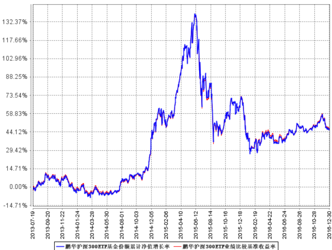
鹏华沪深300ETF基金份额累计净值增长率与同期业绩比较基准收益率的历史走势对比图