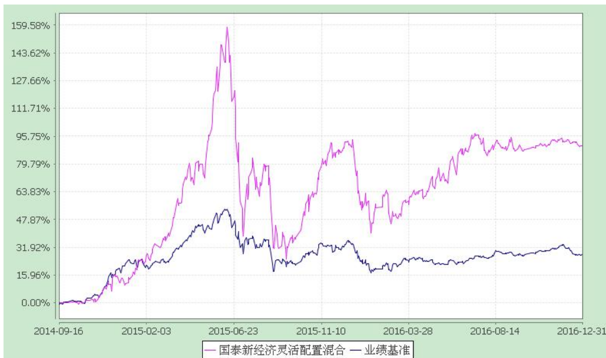
自基金合同生效以来份额累计净值增长率与业绩比较基准收益率的历史走势对比图 (2014 年 9 月 16 日至 2016 年 12 月 31 日)

注：本基金的建仓期为 6 个月，本基金在 6 个月建仓期结束时，各项资产配置比例符合合同约定。