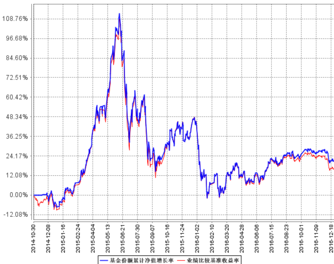
基金份额累计净值增长率与同期业绩比较基准收益率的历史走势对比图