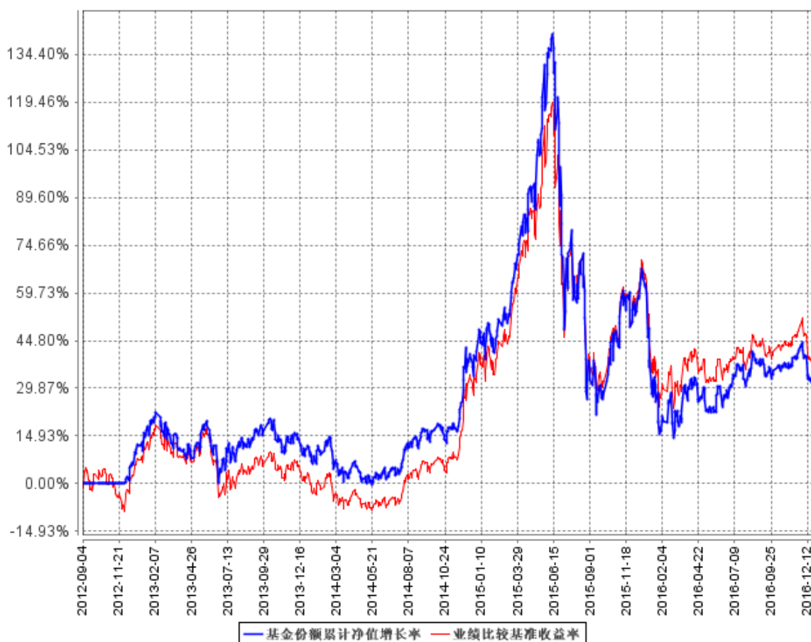
基金份额累计净值增长率与同期业绩比较基准收益率的历史走势对比图

注：本基金股票投资比例范围为基金资产的 90%—95%，投资于标的指数成分股及其备选股的比例不低于股票投资的 80%，现金或到期日在一年以内的政府债券投资比例不低于基金资产净值的 5%。本基金建仓期为基金合同生效日（2012 年 9 月 4 日）起六个月，建仓期满时，本基金各项投资比例已达到基金合同规定的投资比例。