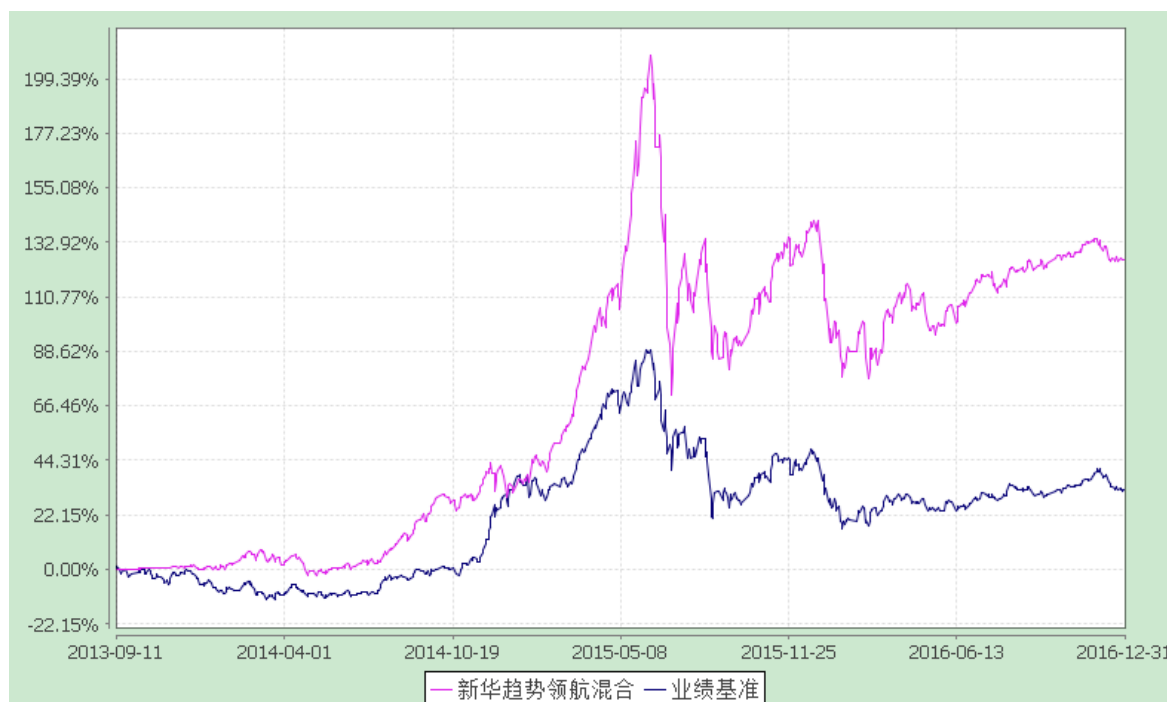
份额累计净值增长率与业绩比较基准收益率的历史走势对比图 (2013 年 9 月 11 日至 2016 年 12 月 31 日)