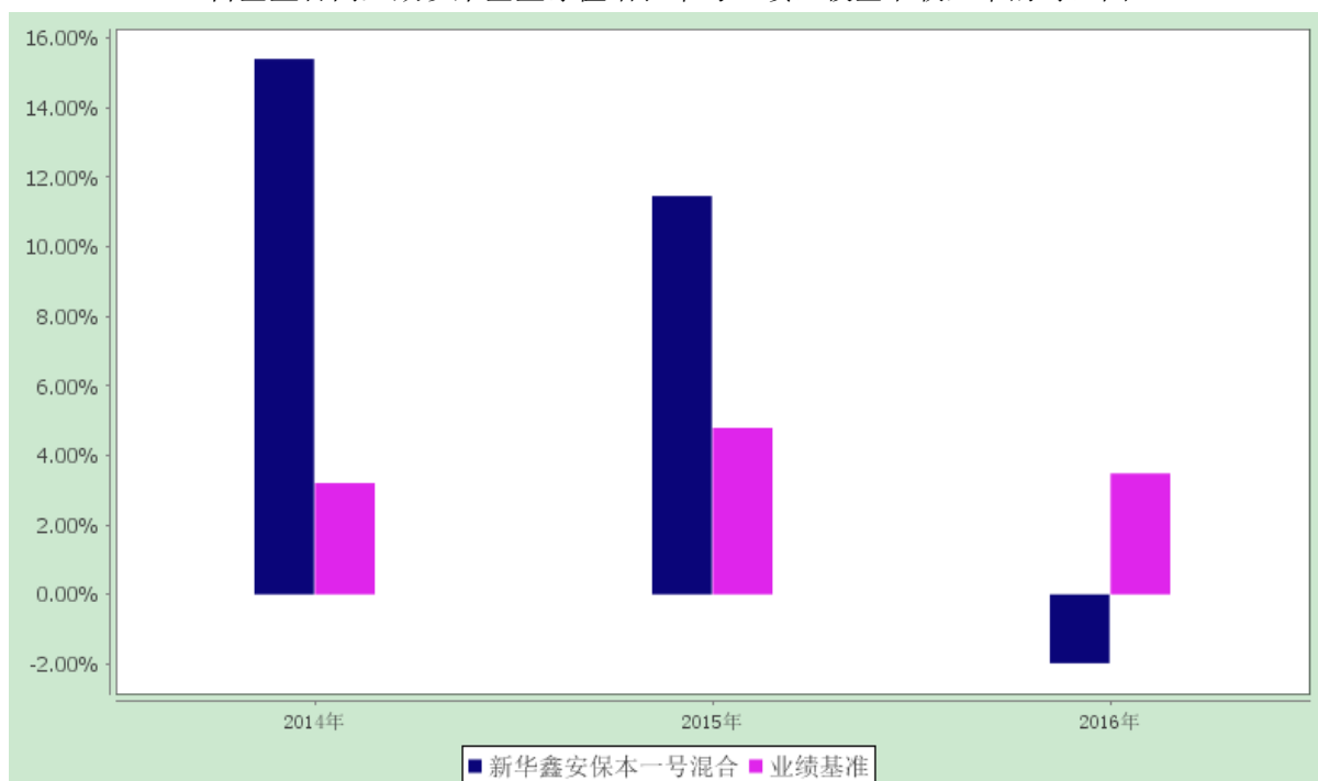
自基金合同生效以来基金净值增长率与业绩比较基准收益率的对比图