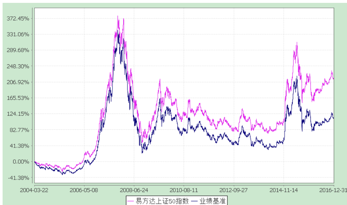
易方达 50 指数证券投资基金 份额累计净值增长率与业绩比较基准收益率历史走势对比图 (2004 年 3 月 22 日至 2016 年 12 月 31 日)

注：自基金合同生效至报告期末，基金份额净值增长率为 215.66%，同期业绩比较基准收益率为 113.38%。