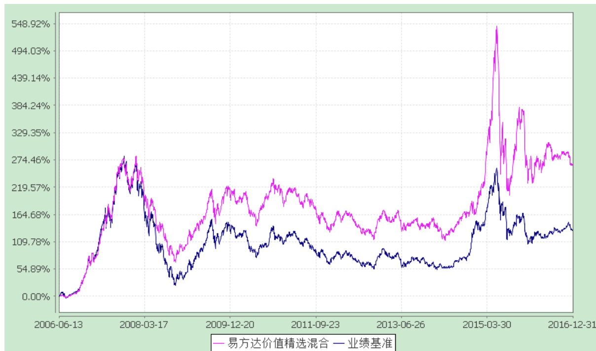
易方达价值精选混合型证券投资基金 份额累计净值增长率与业绩比较基准收益率历史走势对比图 (2006年6月13日至2016年12月31日)

注：自基金合同生效至报告期末，基金份额净值增长率为 264.74%，同期业绩比较基准收益率为 133.22%。