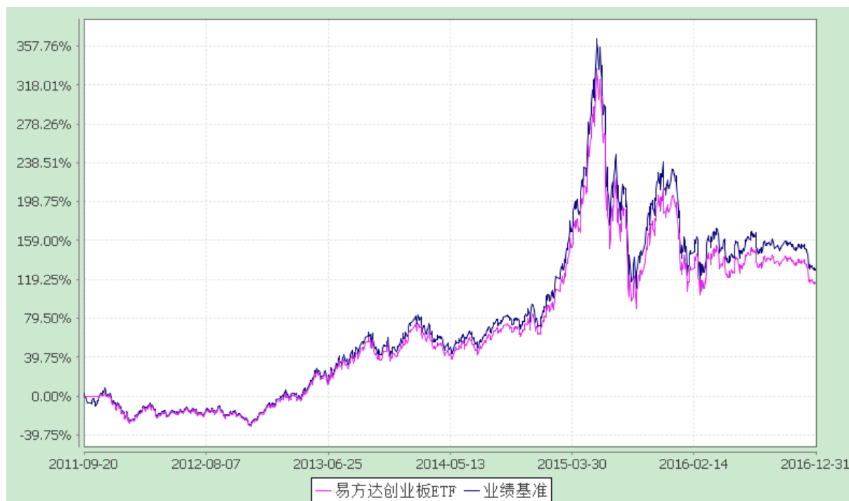
易方达创业板交易型开放式指数证券投资基金 份额累计净值增长率与业绩比较基准收益率历史走势对比图 (2011年9月20日至2016年12月31日)

注：自基金合同生效至报告期末，基金份额净值增长率为 115.51%，同期业绩比较基准收益率为 129.56%。