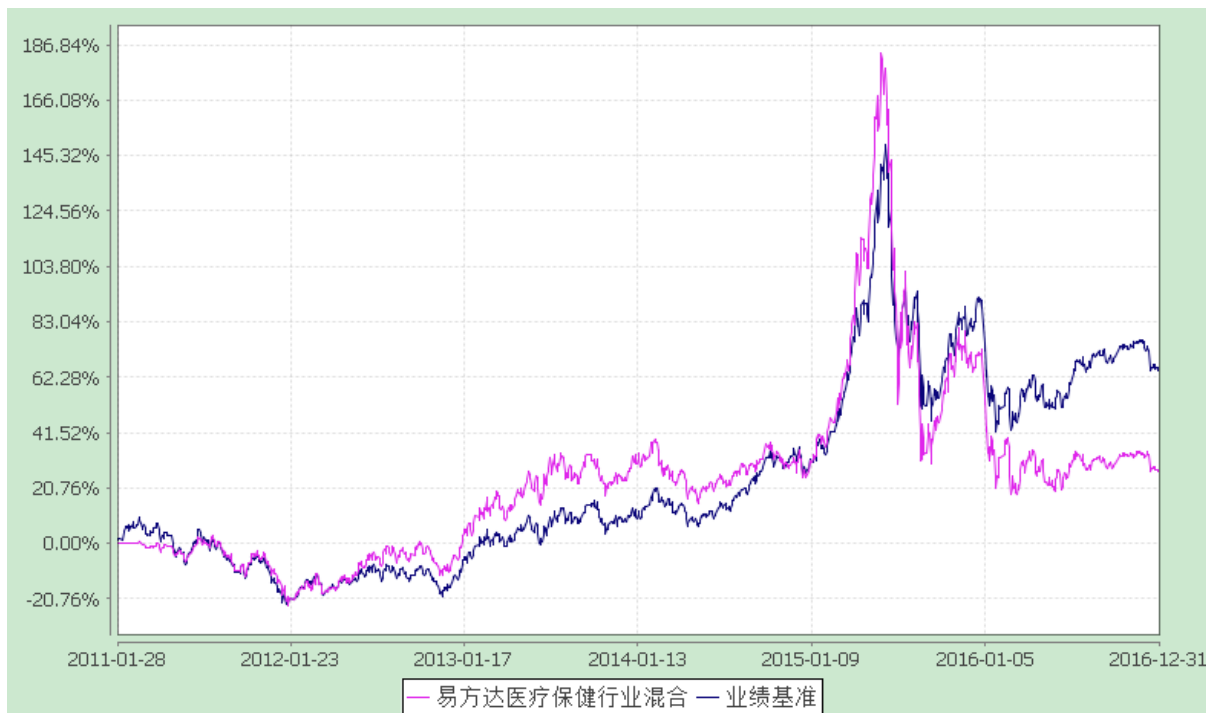
易方达医疗保健行业混合型证券投资基金 份额累计净值增长率与业绩比较基准收益率历史走势对比图 (2011 年 1 月 28 日至 2016 年 12 月 31 日)

注：自基金合同生效至报告期末，基金份额净值增长率为 27.50%，同期业绩比较基准收益率为 66.04%。