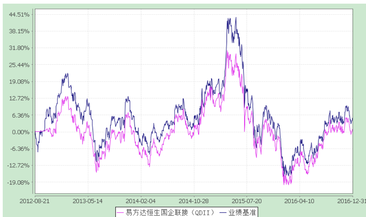
易方达恒生中国企业交易型开放式指数证券投资基金联接基金 份额累计净值增长率与业绩比较基准收益率历史走势对比图 (2012年8月21日至2016年12月31日)