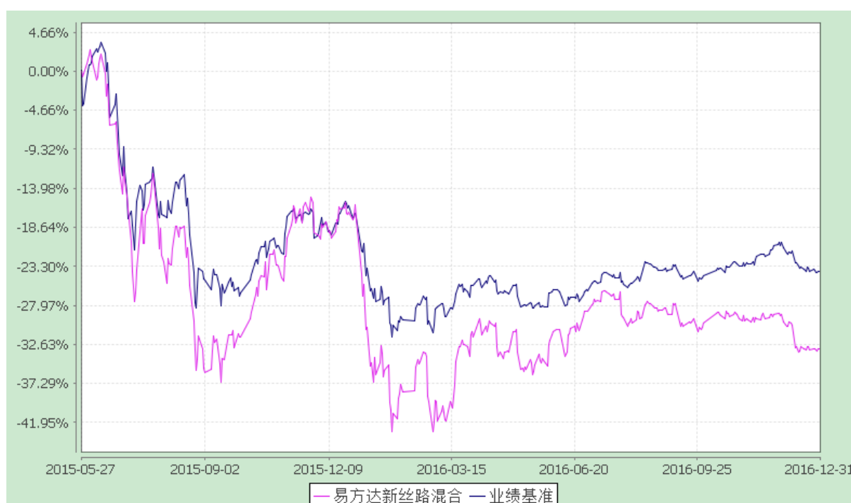
易方达新丝路灵活配置混合型证券投资基金 份额累计净值增长率与业绩比较基准收益率历史走势对比图 (2015年5月27日至2016年12月31日)

注：自基金合同生效至报告期末，基金份额净值增长率为-33.10%，同期业绩比较基准收益率为-23.91%。