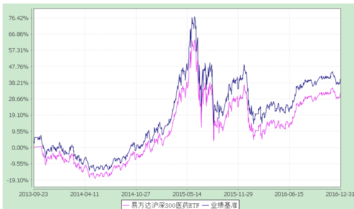
易方达沪深 300 医药卫生交易型开放式指数证券投资基金 份额累计净值增长率与业绩比较基准收益率历史走势对比图 (2013 年 9 月 23 日至 2016 年 12 月 31 日)

注：自基金合同生效至报告期末，基金份额净值增长率为 31.92%，同期业绩比较基准收益率为 40.25%。