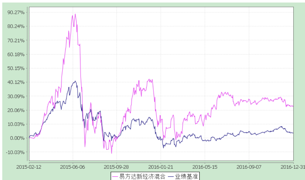
易方达新经济灵活配置混合型证券投资基金 份额累计净值增长率与业绩比较基准收益率历史走势对比图 (2015年2月12日至2016年12月31日)

注：自基金合同生效至报告期末，基金份额净值增长率为 22.90%，同期业绩比较基准收益率为 3.74%。