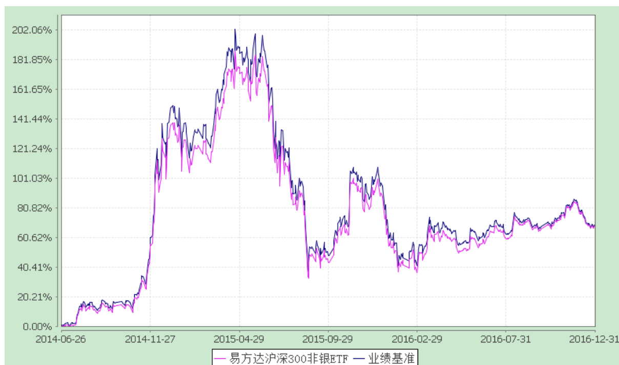
易方达沪深 300 非银行金融交易型开放式指数证券投资基金 份额累计净值增长率与业绩比较基准收益率历史走势对比图 (2014 年 6 月 26 日至 2016 年 12 月 31 日)

注：自基金合同生效至报告期末，基金份额净值增长率为 68.10%，同期业绩比较基准收益率为 68.94%。