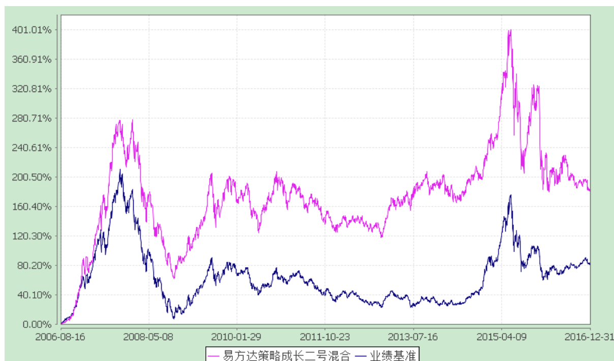
易方达策略成长二号混合型证券投资基金 份额累计净值增长率与业绩比较基准收益率历史走势对比图 (2006年8月16日至2016年12月31日)

注：自基金合同生效至报告期末，基金份额净值增长率为 181.33%，同期业绩比较基准收益率为 81.64%。