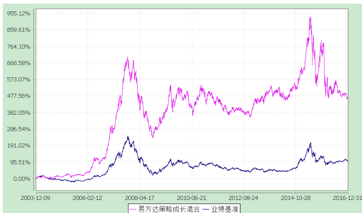
易方达策略成长证券投资基金 份额累计净值增长率与业绩比较基准收益率历史走势对比图 (2003 年 12 月 9 日至 2016 年 12 月 31 日)

注：自基金合同生效至报告期末，基金份额净值增长率为 462.11%，同期业绩比较基准收益率为 102.81%。