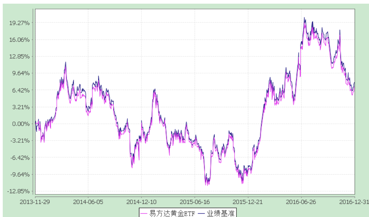
易方达黄金交易型开放式证券投资基金 份额累计净值增长率与业绩比较基准收益率历史走势对比图 (2013年11月29日至2016年12月31日)

注：自基金合同生效至报告期末，基金份额净值增长率为 7.02%，同期业绩比较基准收益率为 7.89%。