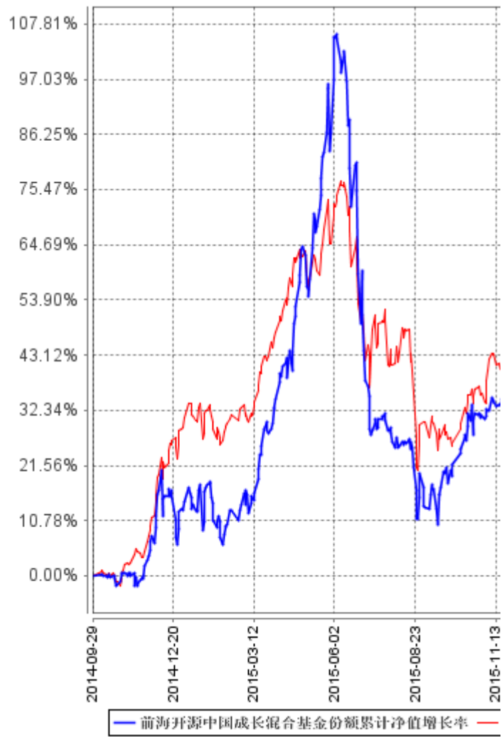
自基金合同生效以来基金每年净值增长率及其与同期业绩比较基准收益率的比较