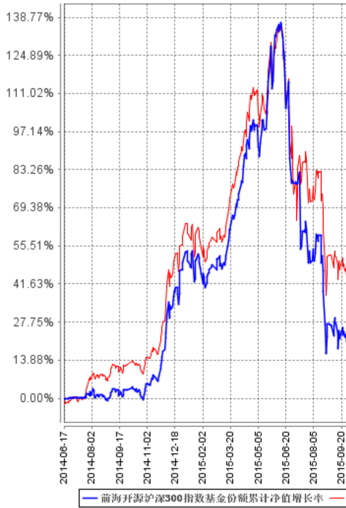
自基金合同生效以来基金每年净值增长率及其与同期业绩比较基准收益率的比较