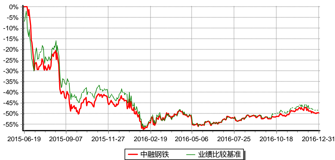
图：中融国证钢铁行业指数分级证券投资基金份额累计净值增长率与同期业绩比较基准收益率的历史走势对比图