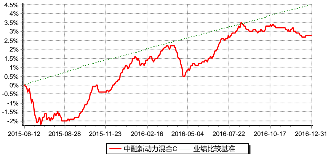
图:中融新动力混合C份额累计净值增长率与同期业绩比较基准收益率的历史走势对比图 (2015年6月12日至2016年12月31日)

注:按基金合同和招募说明书的约定,本基金自基金合同生效日起6个月内为建仓期,建仓期结束时本基金的各项资产配置比例符合基金合同的有关约定