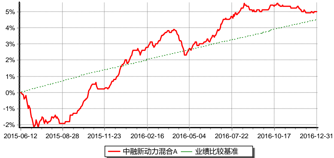
图:中融新动力混合A份额累计净值增长率与同期业绩比较基准收益率的历史走势对比图 (2015年6月12日至2016年12月31日)