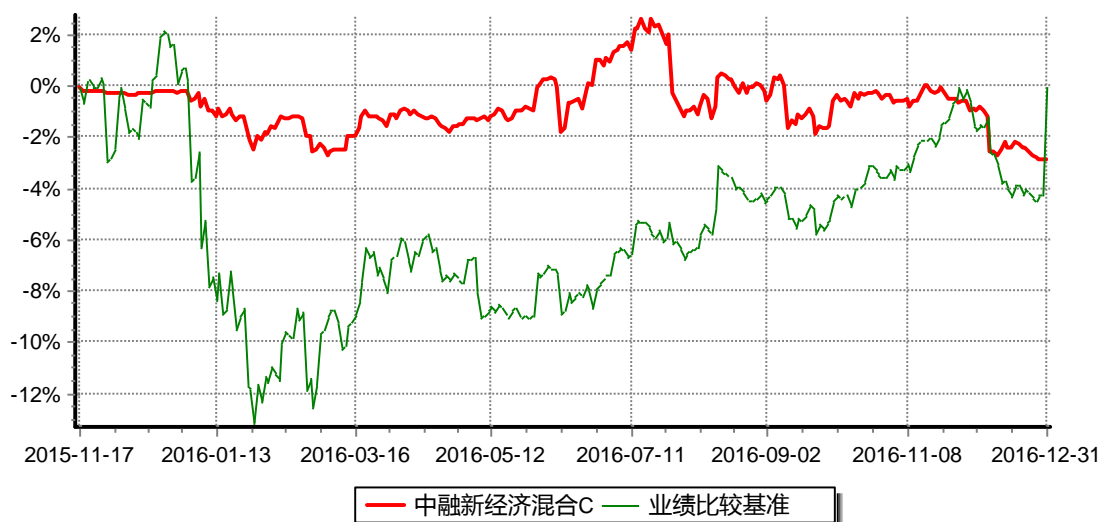
图：中融新经济混合C累计净值增长率与同期业绩比较基准收益率的历史走势对比图 (2015年11月17日至2016年12月31日)

注：按照合同和招募说明书的约定，本基金自合同生效日起6个月内为建仓期，建仓期结束时本基金的各项资产配置比例符合基金合同的有关约定。