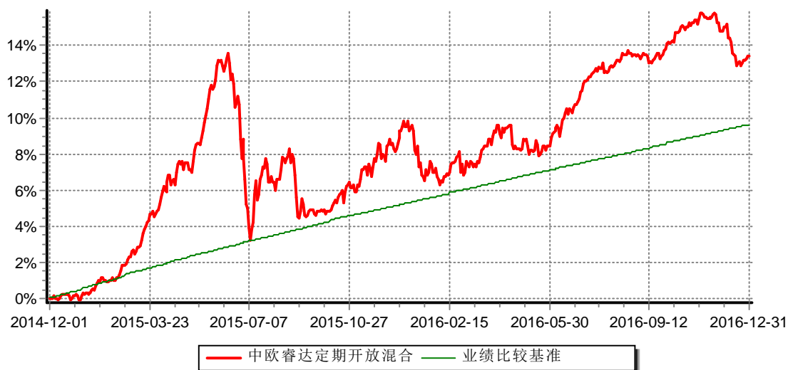
中欧睿达定期开放混合型发起式证券投资基金 份额累计净值增长率与业绩比较基准收益率历史走势对比图 (2014年12月1日(基金合同生效日)-2016年12月31日)