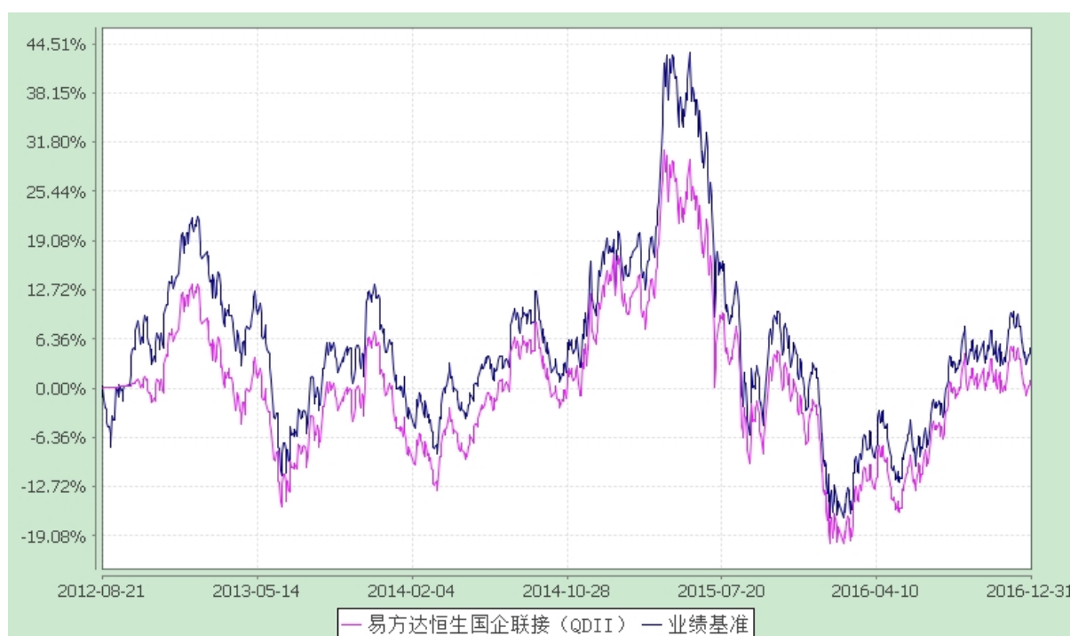
易方达恒生中国企业交易型开放式指数证券投资基金联接基金 份额累计净值增长率与业绩比较基准收益率历史走势对比图 (2012年8月21日至2016年12月31日)