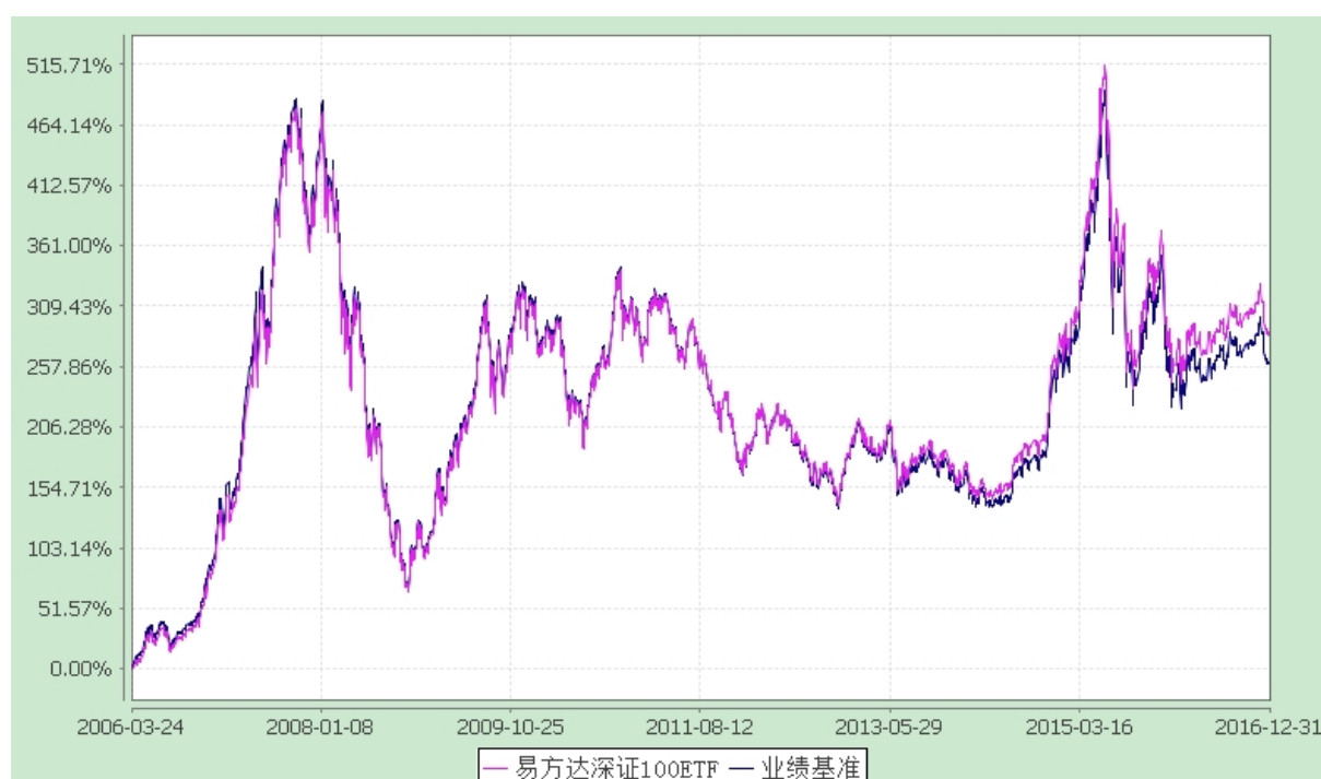
易方达深证 100 交易型开放式指数基金 份额累计净值增长率与业绩比较基准收益率历史走势对比图 (2006 年 3 月 24 日至 2016 年 12 月 31 日)

注：自基金合同生效至报告期末，基金份额净值增长率为 286.20%，同期业绩比较基准收益率为 260.62%。