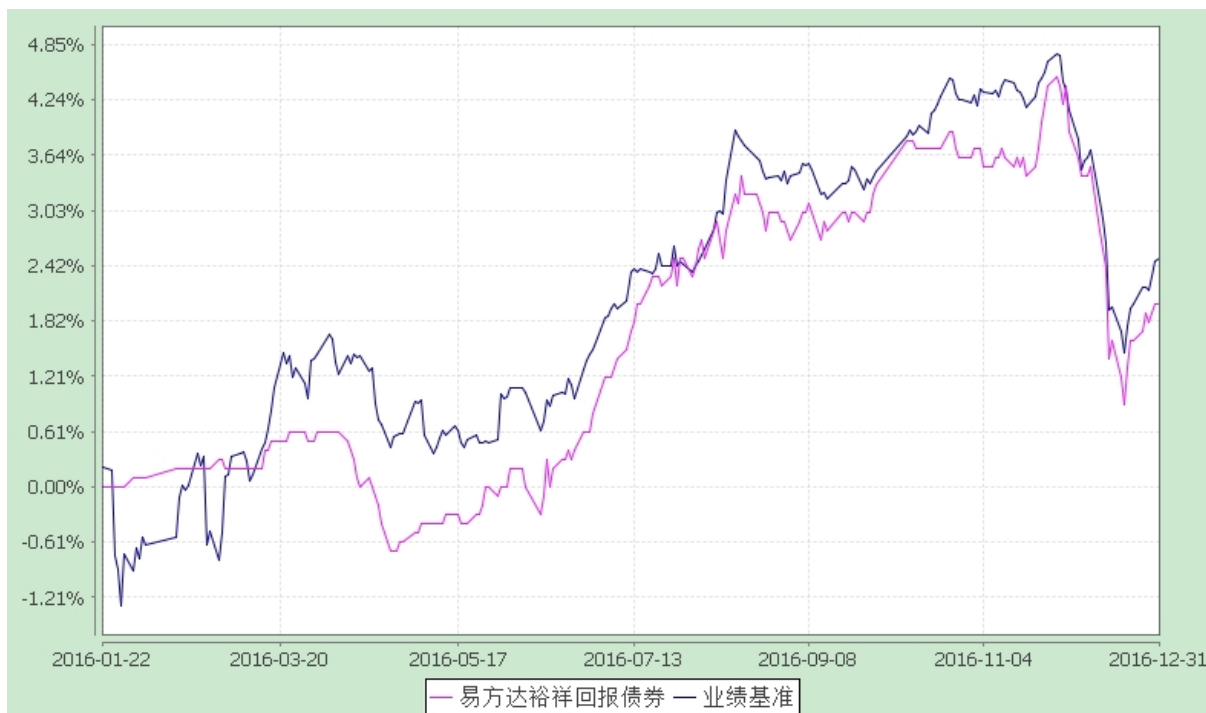
易方达裕祥回报债券型证券投资基金 份额累计净值增长率与业绩比较基准收益率历史走势对比图 (2016 年 1 月 22 日至 2016 年 12 月 31 日)

注：1.本基金合同于 2016 年 1 月 22 日生效，截至报告期末本基金合同生效未满一年。