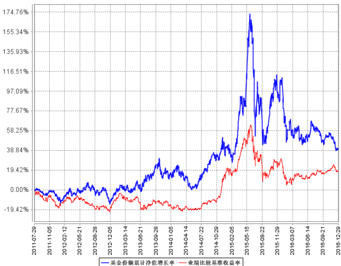
基金份额累计净值增长率与同期业绩比较基准收益率的历史走势对比图

注：1、按基金合同规定，基金管理人应当自基金合同生效之日起 6 个月内使基金的投资组合比例符合基金合同的有关约定：本基金投资的股票资产占基金资产的 60%—95%，债券、现金等金融工具占基金资产的比例为 5%—40%，现金或者到期日在一年以内的政府债券不低于基金资产净值的 5%，权证的投资比例不超过基金资产净值的 3%，资产支持证券的投资比例不超过基金资产净值的 20%。本基金将不低于 80% 的股票资产投资于受消费驱动的上市公司。