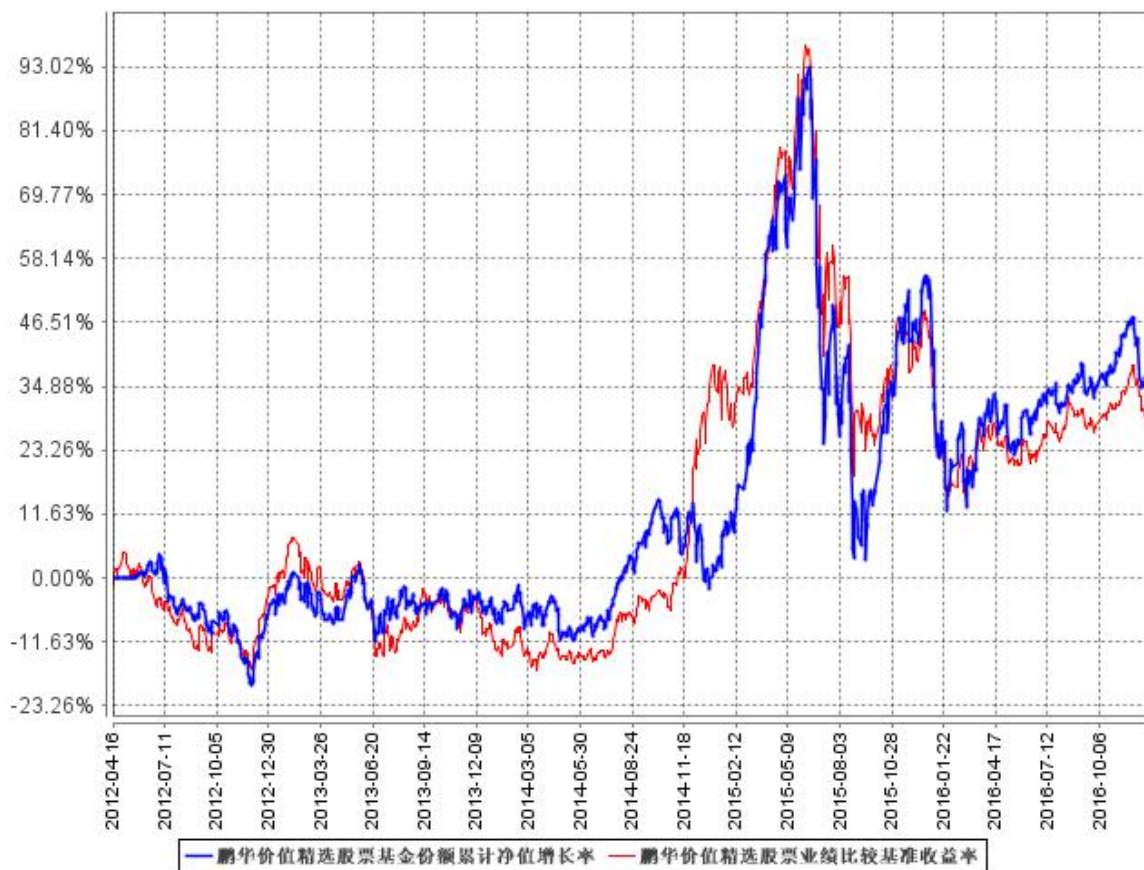
鹏华价值精选股票基金份额累计净值增长率与同期业绩比较基准收益率的历史走势对比图