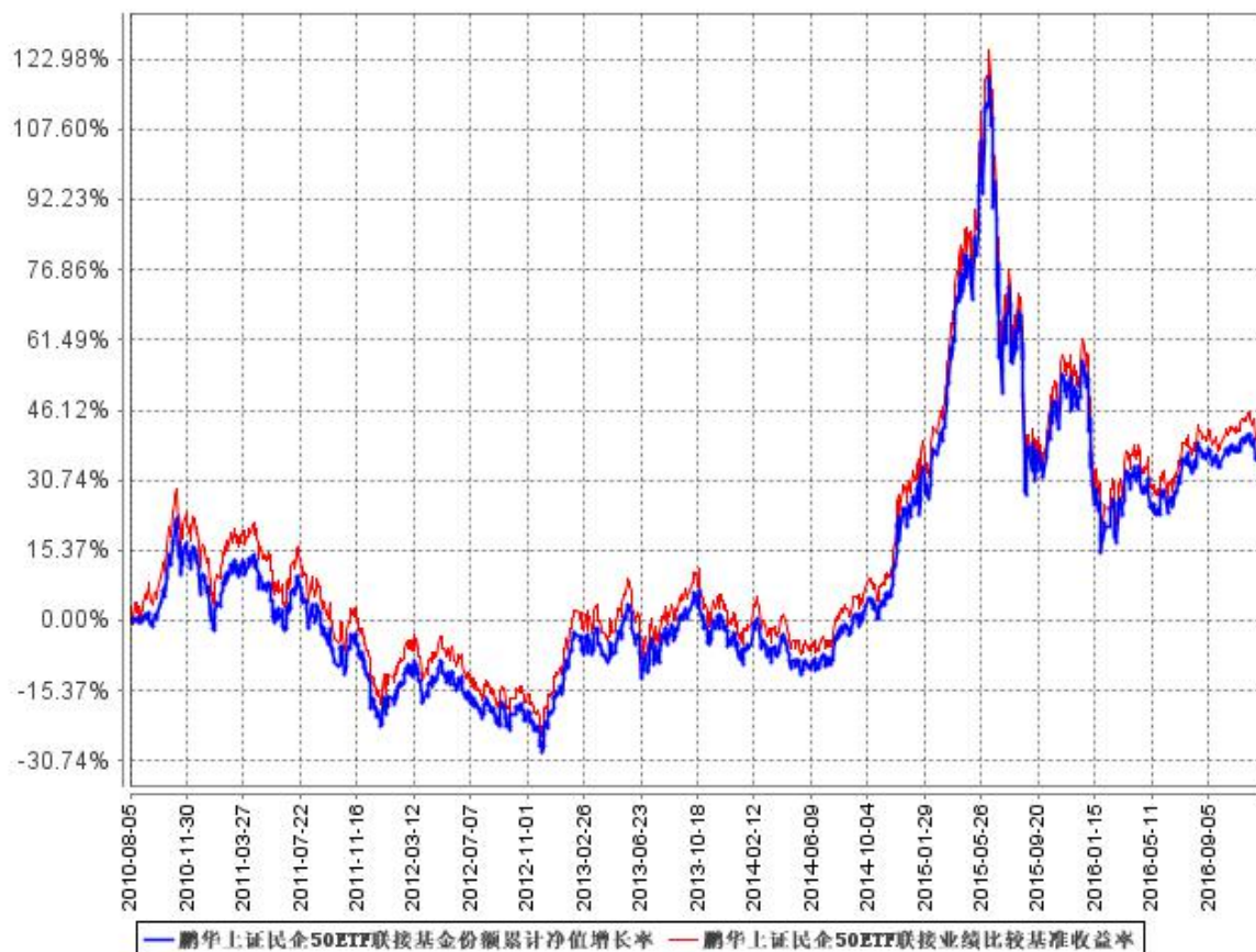
鹏华上证民企 50ETF 联接基金份额累计净值增长率与同期业绩比较基准收益率的历史走势对比图