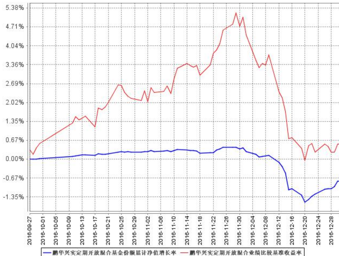
鹏华兴实定期开放混合基金份额累计净值增长率与同期业绩比较基准收益率的历史走势对比图

注：1、本基金基金合同于 2016 年 9 月 27 日生效，截至本报告期末本基金基金合同生效未满一年。 2、本基金管理人将严格按照本基金合同的约定，于本基金建仓期届满后确保各项投资比例符合基金合同的约定。