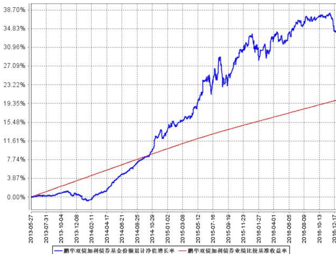
鹏华双债加利债券基金份额累计净值增长率与同期业绩比较基准收益率的历史走势对比图