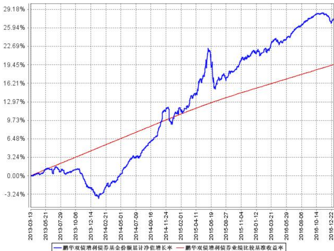
鹏华双债增利债券基金份额累计净值增长率与同期业绩比较基准收益率的历史走势对比图